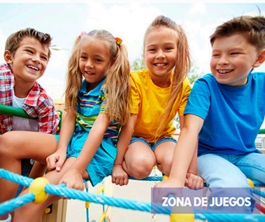
ZONA DE JUEGOS