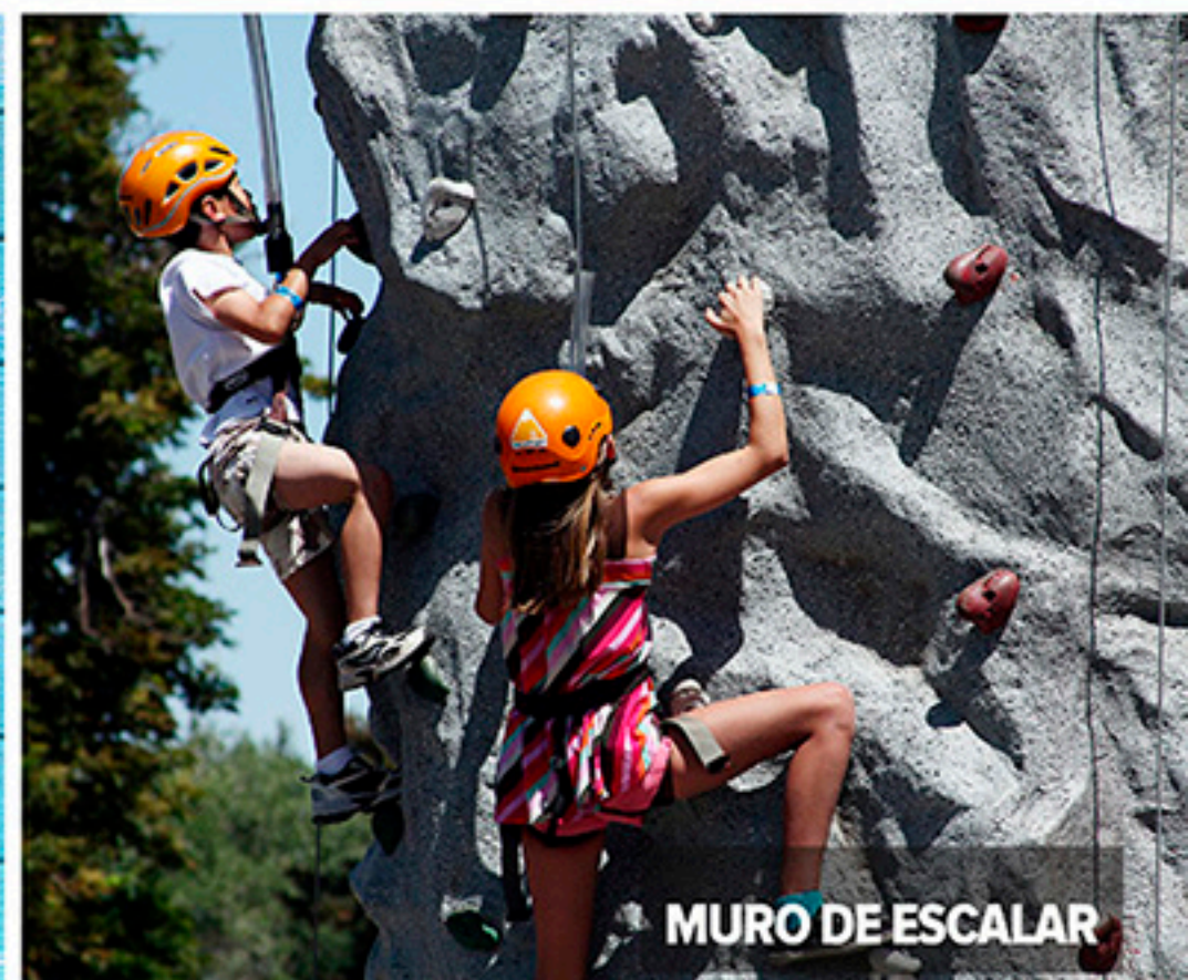
MURO DE ESCALAR